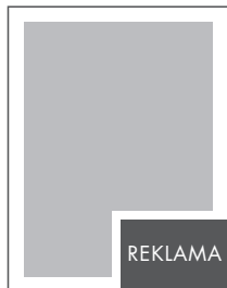
1/8 STRONY NETTO: 97 x 70 BRUTTO: 107 x 80