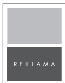
1/2 STRONY POZIOM W RAMCE NETTO: 190 x 118