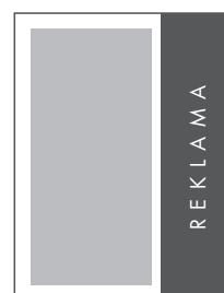
1/3 STRONY PION NETTO: 64 x 270 BRUTTO: 74 x 280