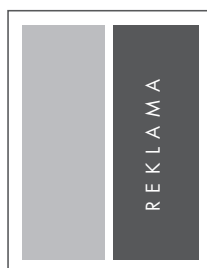
1/2 STRONY PION W RAMCE NETTO: 90 x 240