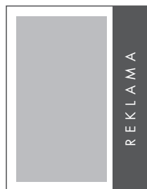
1/4 STRONY PION NETTO: 49 x 270 BRUTTO: 59 x 280