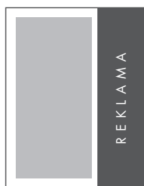
1/3 STRONY PION NETTO: 70 x 275 BRUTTO: 80 x 285