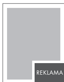
1/8 STRONY NETTO: 98 x 63 BRUTTO: 108 x 73