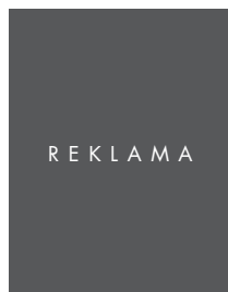
OKŁADKA, 1/1 STRONY NETTO: 205 x 270 BRUTTO: 215 x 280