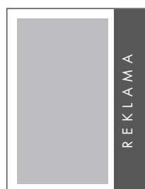
1/4 STRONY PION NETTO: 49 x 270 BRUTTO: 59 x 280