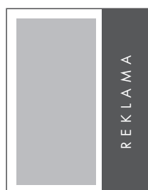
1/3 STRONY PION