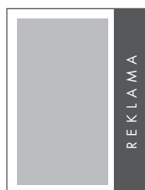
1/4 STRONY PION