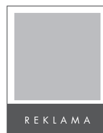
1/4 STRONY POZIOM