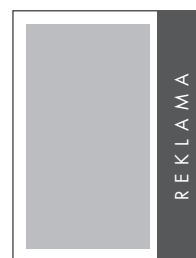
1/4 STRONY PION NETTO: 55 x 280 BRUTTO: 65 x 290