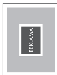
WYSPA NETTO: 83 x 112 BRUTTO: 93 x 122