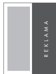
1/2 STRONY PION NETTO: 102 x 280 BRUTTO: 112 x 290