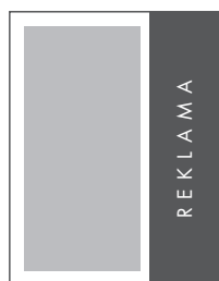
1/3 STRONY PION NETTO: 71 x 280 BRUTTO: 81 x 290