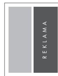
1/2 STRONY PION W RAMCE NETTO: 95 x 258