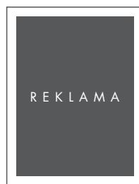
STRONA W RAMCE NETTO: 190 x 260