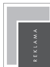
JUNIOR PAGE NETTO: 149 x 200 BRUTTO: 159 x 210