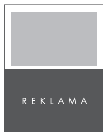
1/2 STRONY POZIOM NETTO: 205 x 135 BRUTTO: 215 x 145