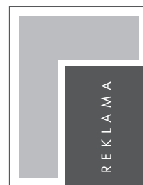
JUNIOR PAGE NETTO: 145 x 205 BRUTTO: 155 x 215