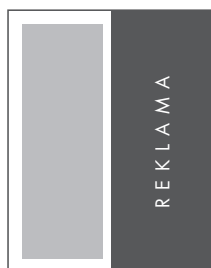
1/2 STRONY PION NETTO: 100 x 270 BRUTTO: 110 x 280