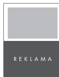
1/2 STRONY POZIOM NETTO: 205 x 135 BRUTTO: 215 x 145