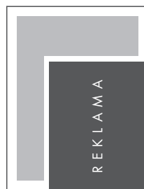
JUNIOR PAGE NETTO: 155 x 200 BRUTTO: 165 x 210