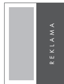
1/2 STRONY PION NETTO: 106 x 280 BRUTTO: 116 x 290