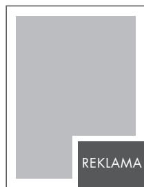
1/8 STRONY NETTO: 106 x 70 BRUTTO: 116 x 80