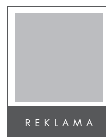
1/4 STRONY POZIOM NETTO: 205 x 62 BRUTTO: 215 x 72