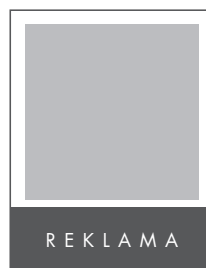
1/4 STRONY POZIOM