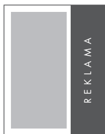
1/3 STRONY PION NETTO: 56 x 230 BRUTTO: 66 x 240