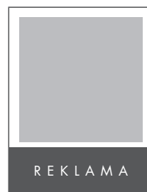
1/4 STRONY POZIOM