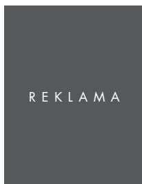
OKŁADKA, 1/1 STRONY