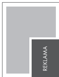
1/4 STRONY KRZYŻ