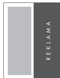
1/2 STRONY PION