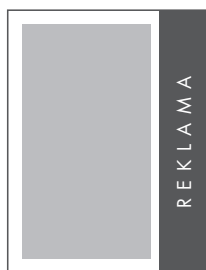
1/4 STRONY PION