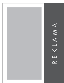
1/3 STRONY PION