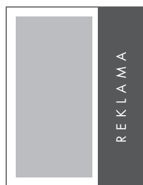
1/3 STRONY PION NETTO: 70 x 275 BRUTTO: 80 x 285