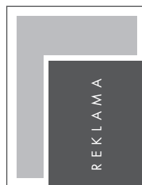
JUNIOR PAGE NETTO: 129 x 202 BRUTTO: 139 x 212