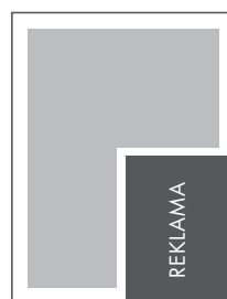
1/4 STRONY KRZYŻ NETTO: 103 x 137 BRUTTO: 113 x 147