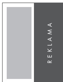
1/2 STRONY PION NETTO: 99 x 270 BRUTTO: 109 x 280